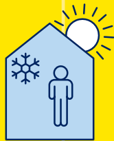
RESTEZ AU FRAIS