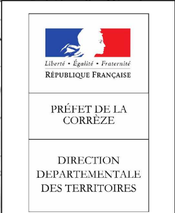
Schéma directeur d'utilisation du plan d'eau de Saint-Pantaléon-de-Lapleau (le Gour Noir) annexe au Règlement particulier de police de la navigation Arrêté préfectoral du 2 octobre 2014