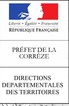
Schéma directeur d'utilisation de la retenue d'Argentat (Le Sablier) annexe au Règlement particulier de police de la navigation Arrêté préfectoral du 25 juin 2015 Sources ING © Scan 25 2009 - DDT 19 - Seper - UE - 11/07/2014 policnav_sd_sablier_ap_28_07_2014.WOR